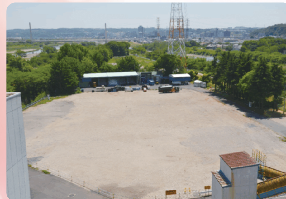
日野市クリーンセンター可燃ごみ処理施設より撮影。

【敷地面積】 日野市クリーンセンターの敷地約2.9haの内、約1.1haを使用して建設します。